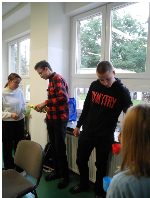
Na oslavu voleb kluci rozdělali šampus.