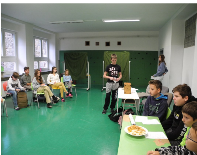
Volí člen volební komise