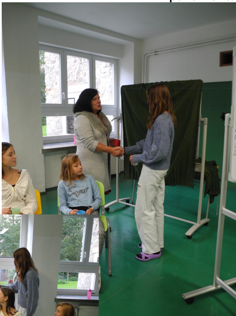
Paní ředitelka gratuluje nové předsedkyni.