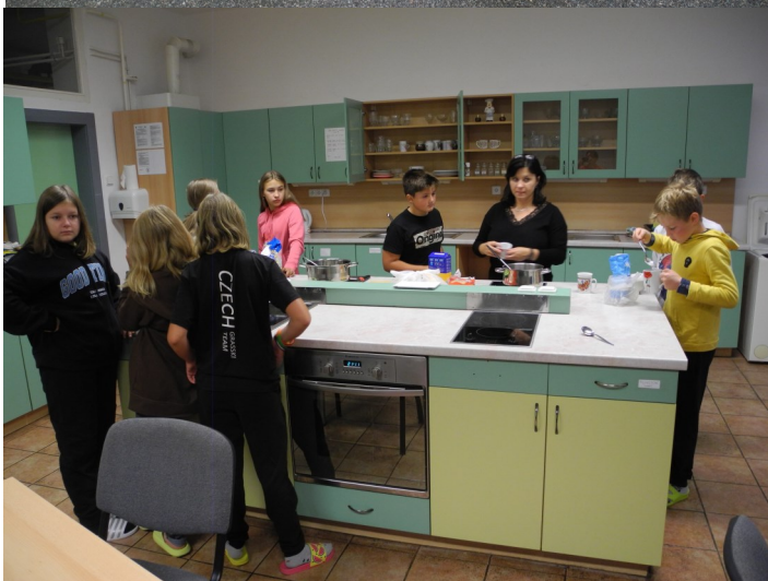
Příprava večeře ve školní kuchyňce