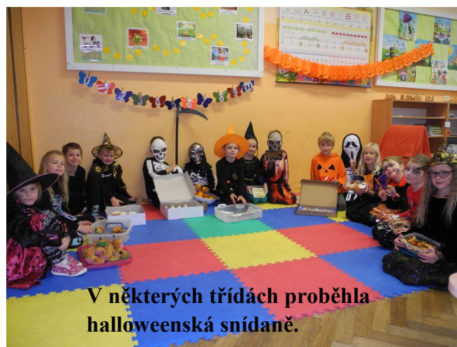
V některých třídách proběhla halloweenská snídaně.