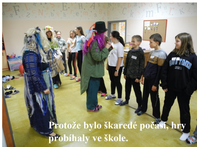
Protože bylo škaredé počasí, hry probíhaly ve škole.

Náš adaptační den začal ráno 19. září v učebně hudební výchovy, kde jsme hráli hry. Po dopoledním programu jsme měli přestávku na oběd. Pak jsme šli na autobus, kterým jsme odjeli do Lanového centra Proud Brno.