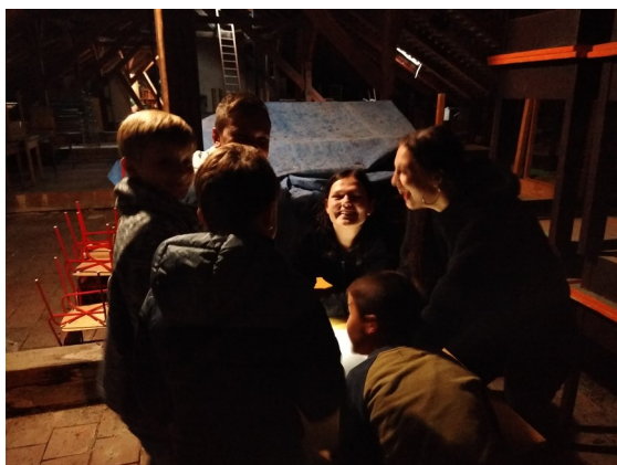
Hledání vraha v tajemných prostorách školní půdy

Po odhalení vraha jsme ve skupinách založili politickou stranu a pracovali jsme na svých volebních programech.