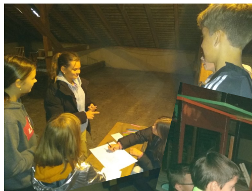
Vymýšlení názvu strany bylo nejzábavnější