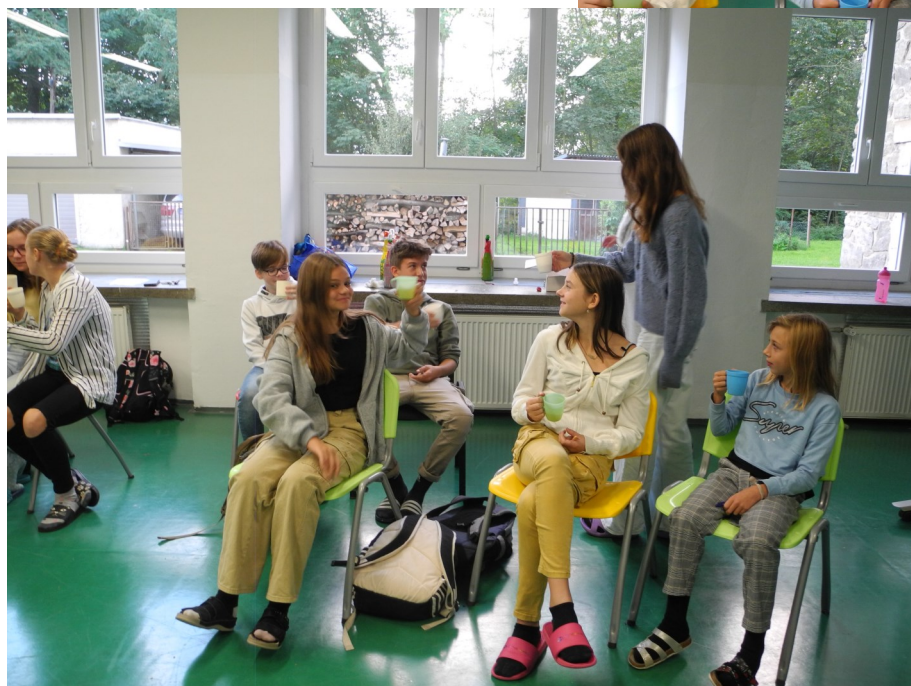
Nová předsedkyně si připijí se členy parlamentu.