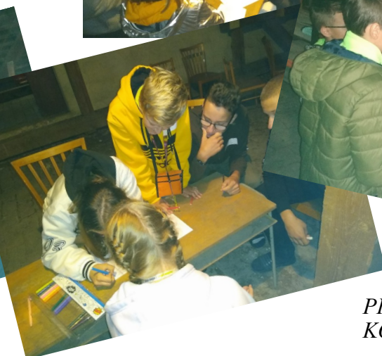
Jak se strany jmenovaly? PROFÍCI, ZBBL, NEZÁVISLÍ, KOMPOSTÁCI, ČPNP, NE