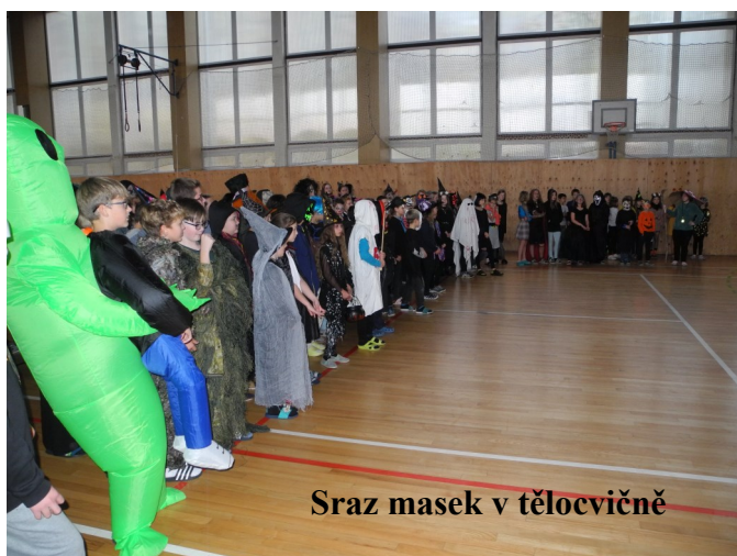
Sraz masek v tělocvičně

Z tělocvičny se všichni vrátili do svých tříd, kde si program halloweenské třídnické hodiny už organizovali sami. Doufáme, že se akce všem líbila a všichni v maskách, ale i diváci si ji užili.